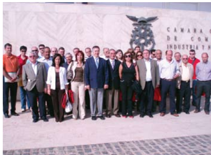
INSTANTÁNEA DE LA VISITA DE LA DELEGACIÓN DE CUEVAS DE ALMANZORA.