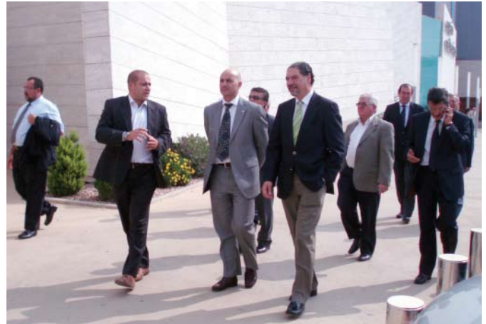
EL ENCUENTRO SIRVIÓ PARA EL INTERCAMBIO DE EXPERIENCIAS ENTRE CÁMARAS./CÁMARA

Aunque el transporte fue el tema principal del