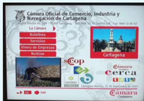
Los contenidos de la Cámara a través de la TDT./CÁMARA.

Este proyecto es pionero nacional en España y contará con un favorable efecto multiplicador mediante su oportuna difusión entre el resto de Cámaras de Comercio de España. Además, posiciona a la Región de Murcia como líder en información empresarial al ser la primera que tendrá servicios en esta nueva plataforma de emisión, la Televisión Digital Terrestre. El portal "+ Cerca TDT Cartagena" se montará sobre la lanzadera de Popular TV Región de Murcia, en el Multiplex Regional y ha sido desarrollado por Global Solutions con el soporte del Centro Tecnológico de las Tecnologías de la Información y las Comunicaciones (CENTIC). Se trata de una aplicación interactiva alimentada con la información que genera la propia Cámara.