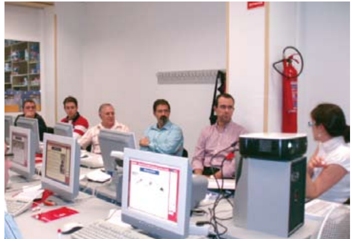
LOS TALLERES SON IMPARTIDOS POR J&A GARRIGUES.

Las conferencias están dirigidas a todos aquellos fundadores empresariales y familiares que quieran profundizar en la materia de la empresa familiar.