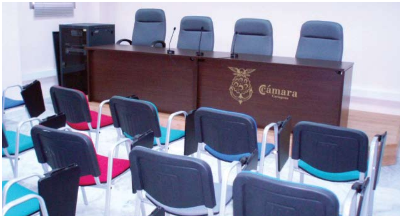
EL VIVERO DE EMPRESAS CUENTA CON DEPENDENCIAS COMUNES PARA LOS EMPRENDEDORES.